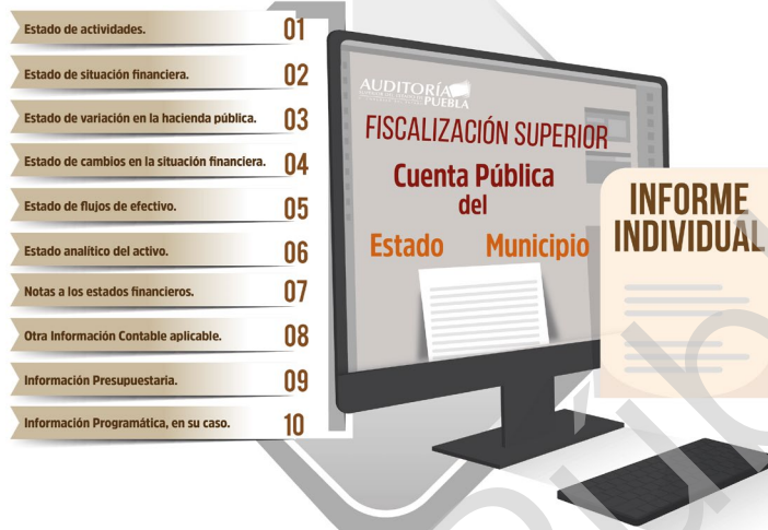
Diagrama 2 Enfoque a Procesos de la Fiscalización Superior 2017